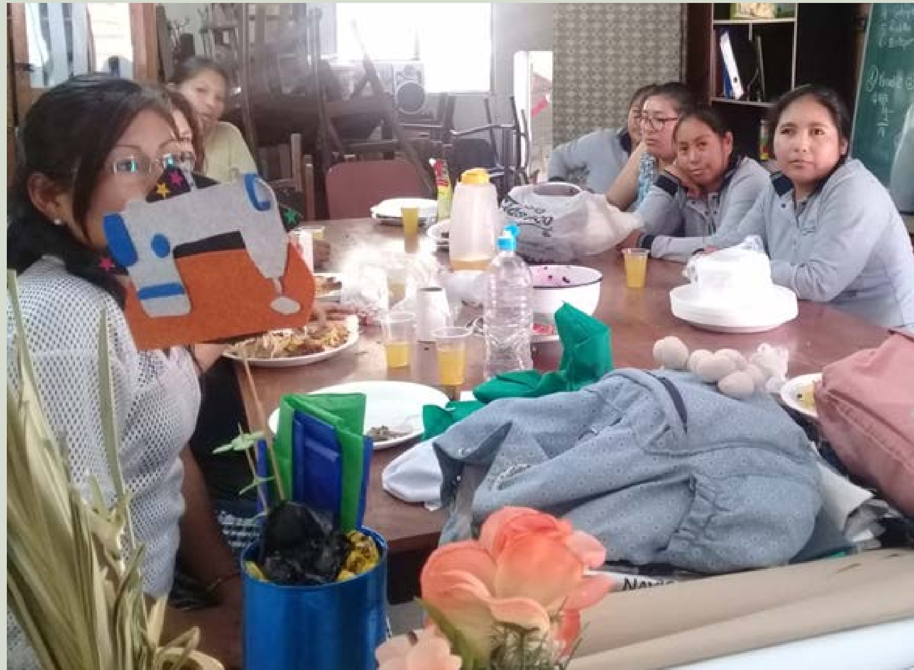
GRUPOS DE JOVENES MADRES