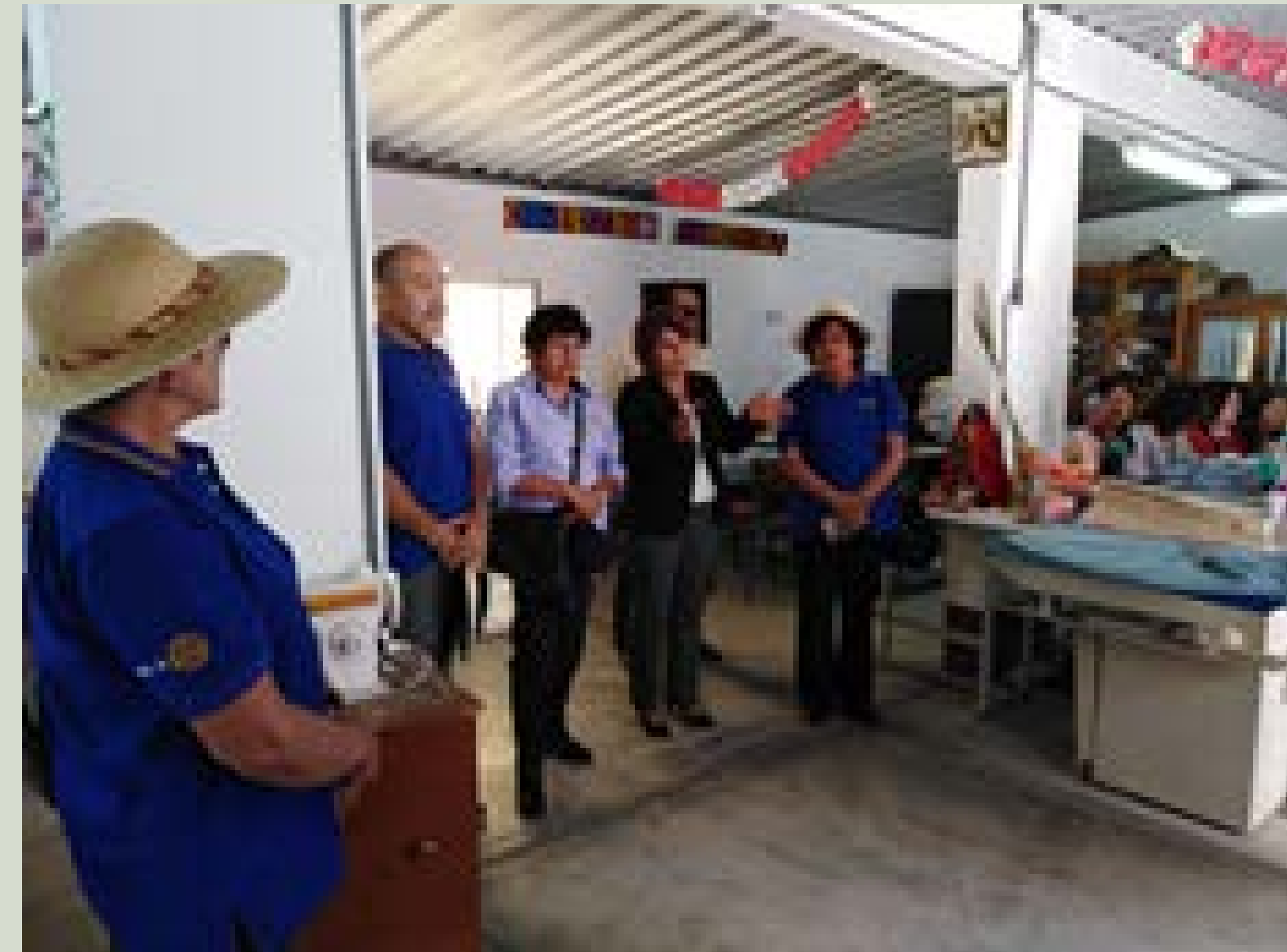
VISITA DE ROTARY A CETPRO

CONTACT: JAVIER CHAVEZ ESPINOZA +51 958 310 866